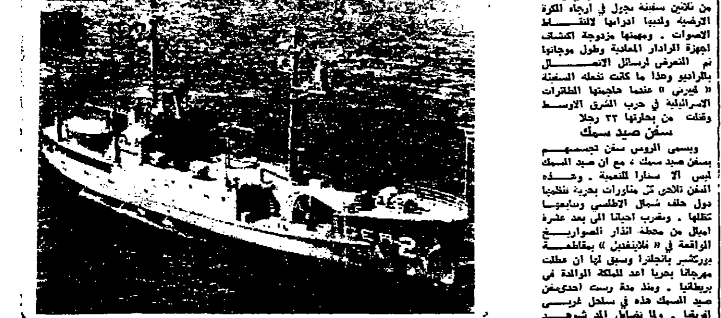
السفينة البحرية « بيولو »

كثير من الأسلحة المنوعة ، منسبل مقومات الرادار المعالي التي تعتمد على خداع اجهزة العدو الالكترونية ، ورش الصواريخ ونقوش السلحة التي يمكن ان تحول انجها باستخدام « مخائف اصطناعية » أثناء طرورها ، والتصويب الفائق بصلاح واحد ضد هدف ممن اصبح غير معد الان ، في حين اصحت الهجمات الكفاسة على الدبرامسيه والتجارية .